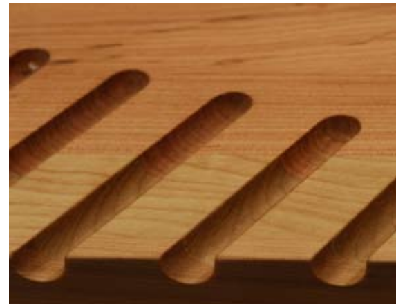
BACK FACE | CARA TRASERA