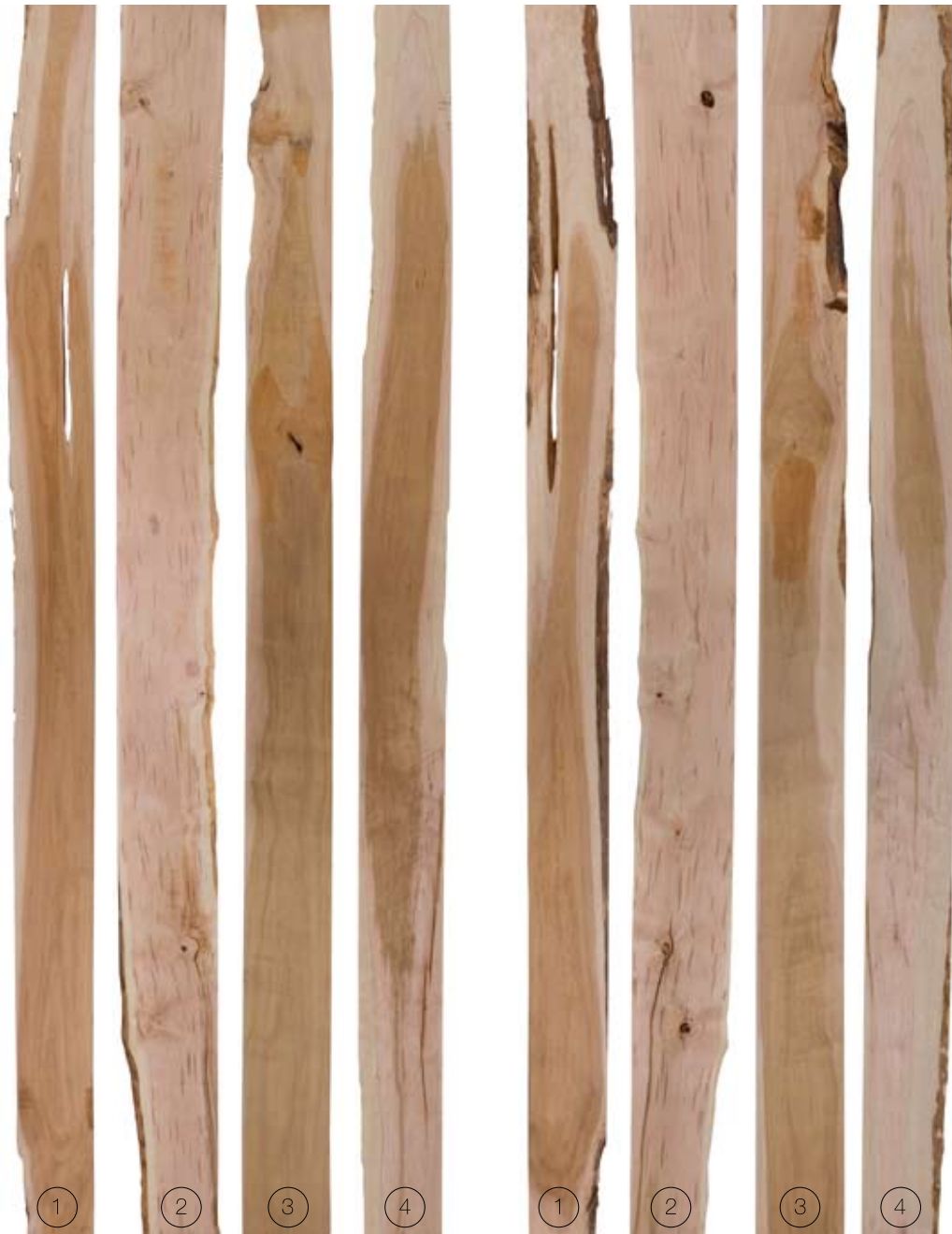
FRONT FACE | CARA FRONTAL

Este grado permite un buen aprovechamiento en piezas medianas y cortas, cuando los colores cafés oscuros y las manchas no son restricción. Es un grado adecuado para la fabricación de muebles y otros productos que serán acabados con tintes oscuros o pintados, o en estilos donde las diferencias de color sea un atributo. Rendimiento de superficie limpia es: Cara Frontal 50% - 83% Cara Posterior 50% - 67%.