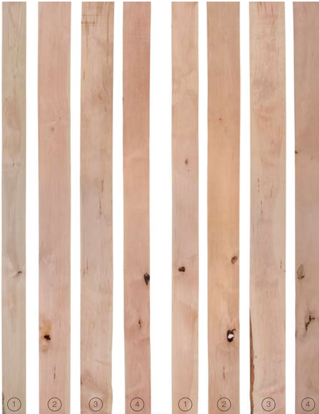
FRONT FACE | CARA FRONTAL

Rendimiento de superficie limpia es 67% - 83% por ambas caras.