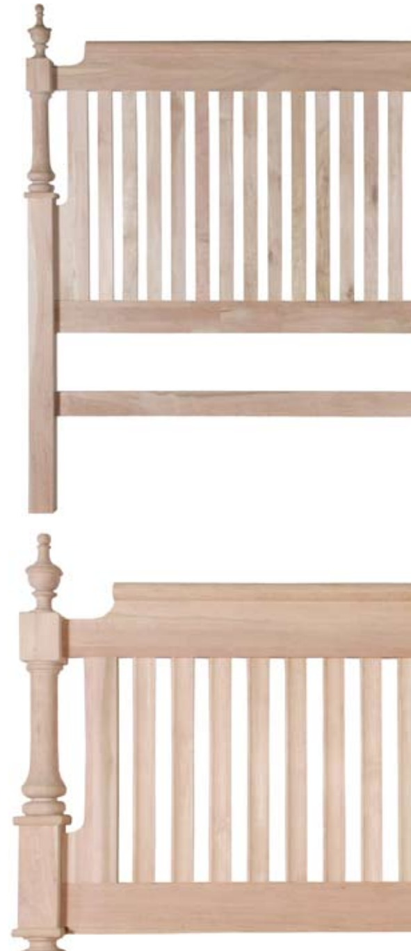
BACK FACE | CARA TRASERA