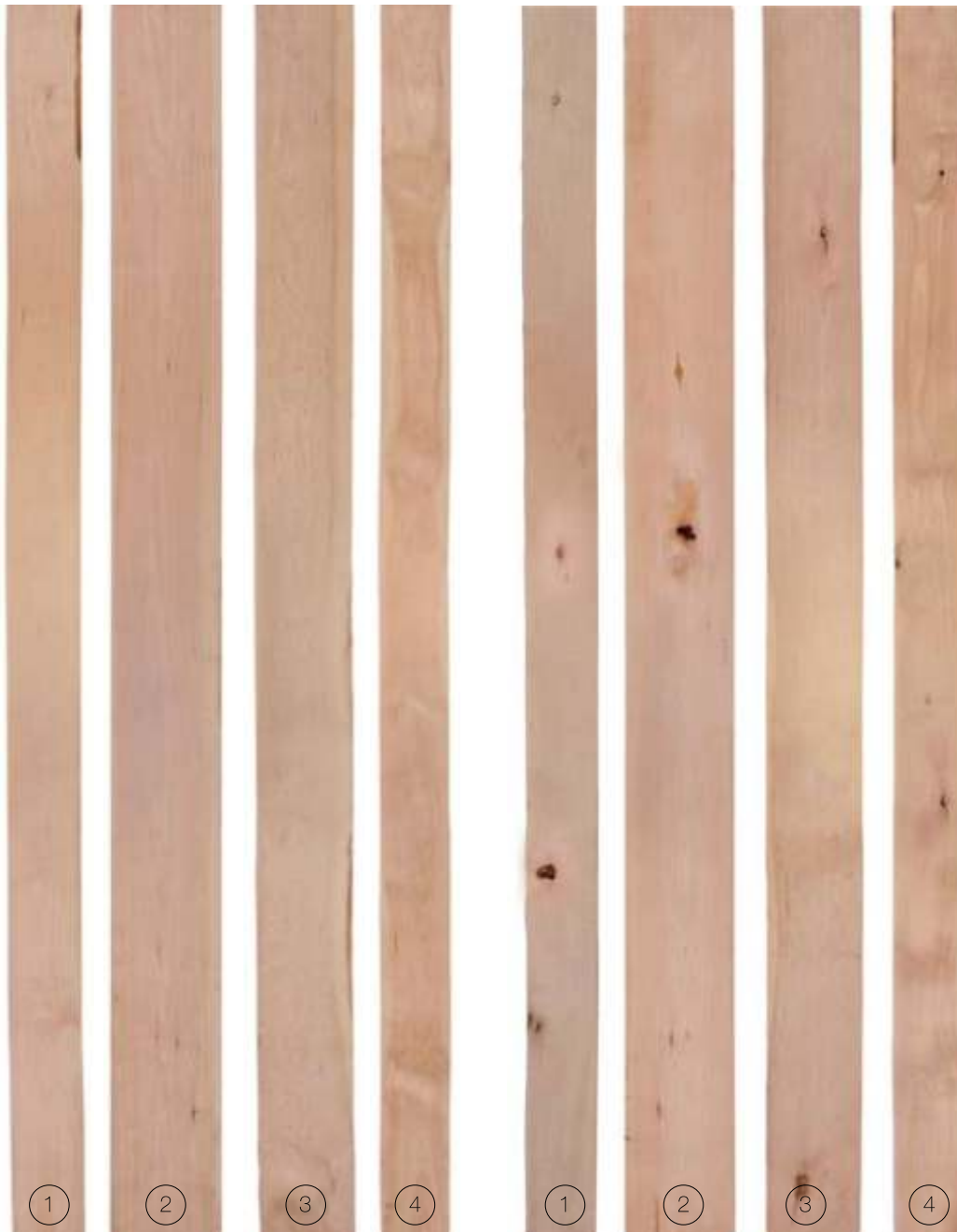
FRONT FACE | CARA FRONTAL

Este grado incluye piezas que por su cara frontal son Primera Selección y por la cara posterior Prime. Esta madera es adecuada para usos donde se requieran piezas medianas y largas, especialmente con una cara visible. Rendimiento mínimo de superficie limpia de 83%-100% por la cara frontal y 67% - 83% por la cara posterior.