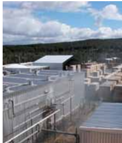
Kiln dryers | Secadores