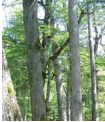
Lenga Forest | Bosque de Lenga

Además, todas nuestras operaciones se realizan bajo un sistema ISO de gestión de calidad, permitiendo asegurar un producto que cumple con las altas exigencias de nuestros clientes, quienes también sienten pasión por las maderas de alto valor.