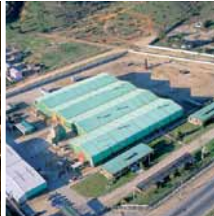
Remanufacturing Plant and headoffice | Planta de Remanufactura y Oficinas Centrales