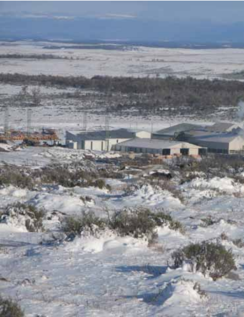
Sawmill / Aserradero Tierra del Fuego, Chile