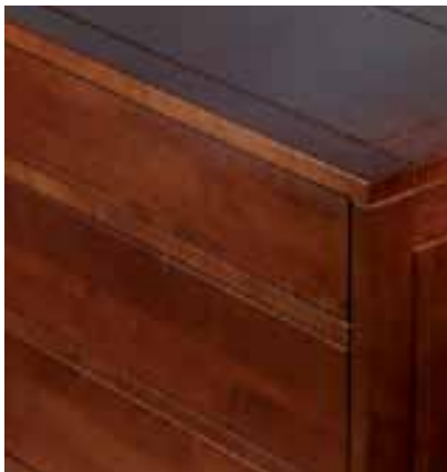
Detail of Lenga Furniture | Detalle de Mueble de Lenga