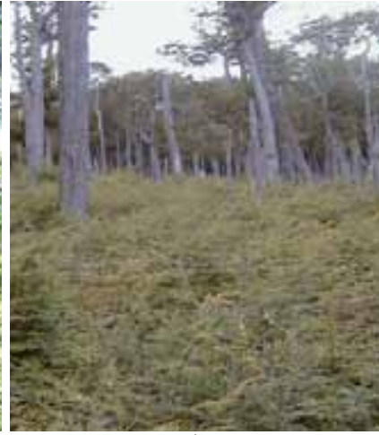
Lenga Renewal Forest | Renoval de Lenga