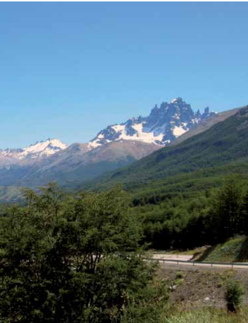
Cerro Castillo, Aysén

Finalmente al poniente cientos de fiordos e islas que generan un hermoso paisaje de canales que se encuentran con el océano pacífico.