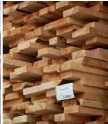
Sawn lumber | Madera Aserrada