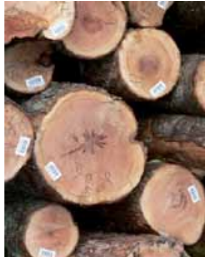
Lenga logs | Trozas de Lenga