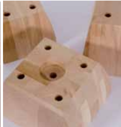
Detail of Furniture Components | Detalle de Componente