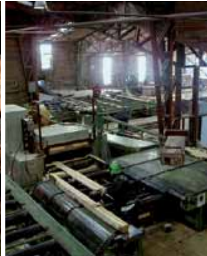
Sawmill | Aserradero