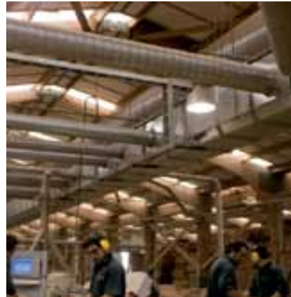
Remanufacturing Plant | Planta de Remanufactura